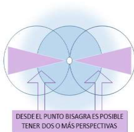
Ilustración 2: Punto bisagra con perspectiva dual.

La diferencia esencial entre un nodo y un punto bisagra, por tanto, reside en que en el punto bisagra coinciden varios espacios de posibilidad incongruentes entre sí (ridículos), de modo que es posible mantener la perspectiva, al mismo tiempo, sobre dos o más espacios de posibilidad (sin saltar aún a ninguno de ellos).