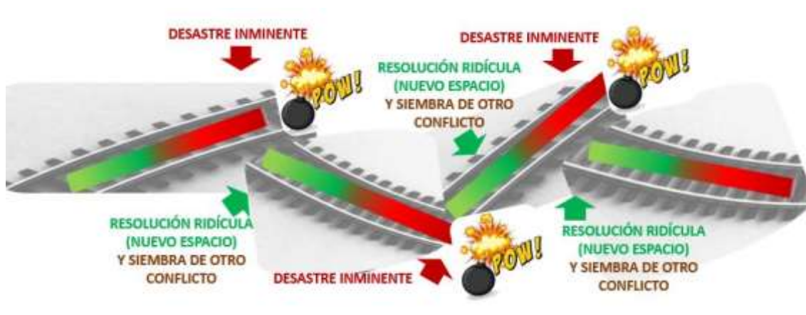
Ilustración 5: Esquema básico de la estructura de la comedia.

Esta concatenación de espacios de posibilidad ridículos de la comedia en ningún caso puede desarrollarse desde la posibilidad, ni expresarse en un único porcentaje, sino únicamente desde una cadena de perspectivas. Es decir, nodos que van abriendo progresivamente espacios de posibilidad de lo imposible , a lo improbable , lo posible , y finalmente lo probable .